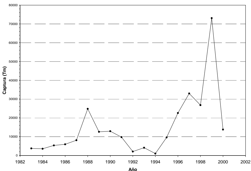
Fig. 3. Evolución de las capturas de dorada en el Mar Menor.